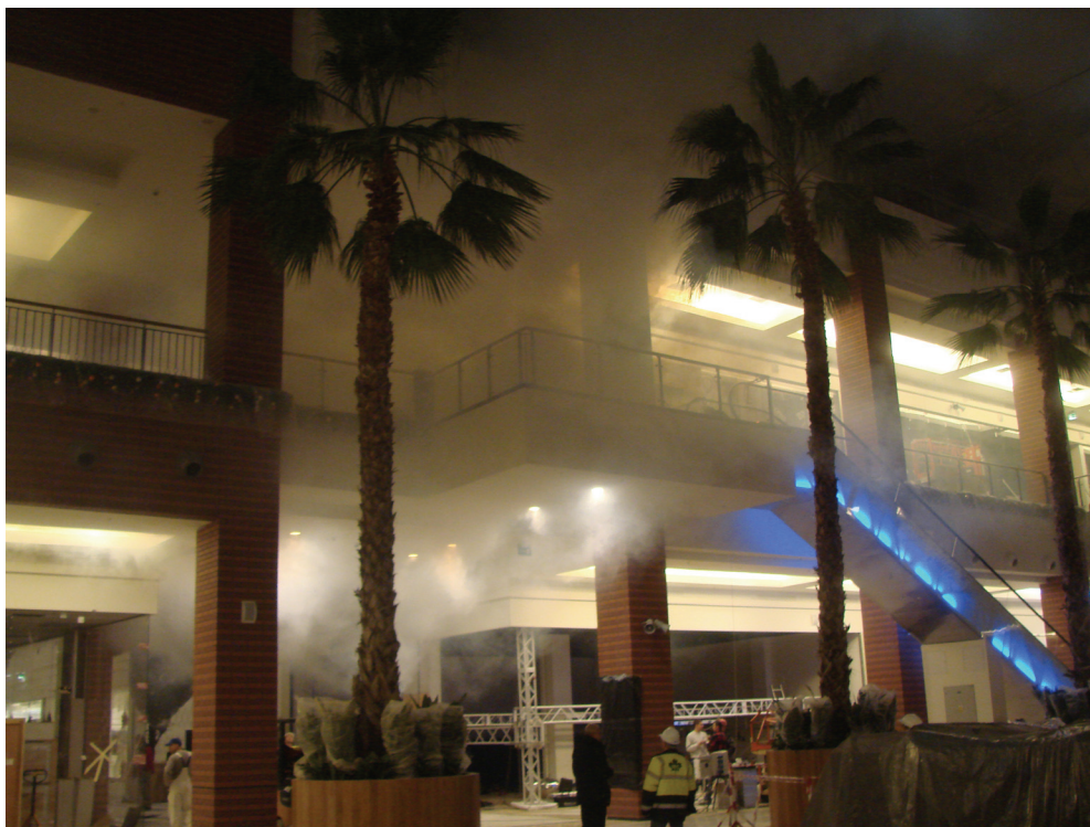
Fot. 1 Obiekt podczas testów z ciepłym dymem

Do wytworzenia dymu stosowane są specjalne wytwornice dymu wraz z dodatkowym oprzyrządowaniem. Istotną cechą tych testów jest ich nieszkodliwość dla zadymianych obiektów, a jednocześnie możliwość symulowania rozwoju zadymienia bliskiego warunkom rzeczywistym [fot. 1].