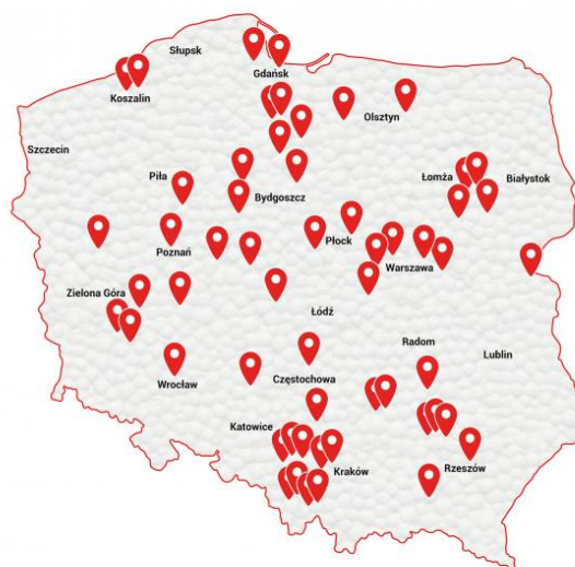
Rysunek 1. Firmy produkujące płyty styropianowe zrzeszone w PSPS

Niniejsza deklaracja EPD odnosi się do płyt z polistyrenu ekspandowanego (EPS) wykorzystywanych w budownictwie. Produkty stosowane są głównie do izolacji termicznej i akustycznej budynków. Wymiary wyrobów mogą się różnić w zależności od producenta i potrzeb rynku oraz konkretnego zastosowania. Uśredniona gęstość EPS wyznaczona na potrzeby EPD, na podstawie danych dostarczonych przez Producentów, wynosi 15 kg/m 3 . Niniejsza EPD ma zastosowanie do jednorodnych produktów EPS, nie zawierających dodatkowych materiałów